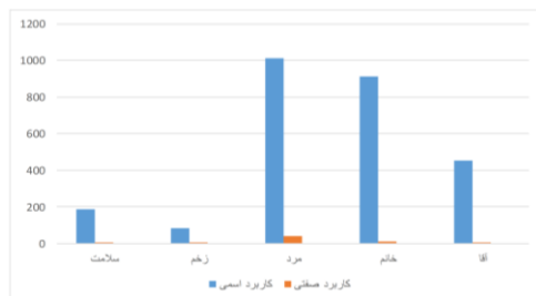
نمودار شماره (۱). بسامد کاربرد صفتی اسم‌ها در فرایند صفت‌سازی

چنانکه جدول فوق نشان می‌دهد، صفت‌های <شیء، توصیف> مورد بررسی مهم‌ترین زیرمعیار که در واقع نقش اولیه صفتی است را برآورده نکرده‌اند، که آنها را از صفت‌های سرنمون جدا می‌کند و به صفت‌های غیرسرنمون نزدیک می‌کند. با این حال، این صفت‌ها به یک اندازه غیرسرنمون نیستند، بلکه در یک پیوستار قرار دارند. نمودار زیر نشان‌دهنده میزان بسامد این کلمات در دو نقش اسمی و صفتی در پیکره بیجن‌خان است: