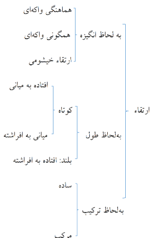
شکل (۱). تقسیمات ارتقاء واکه

می‌توان ارتقاء واکه‌ای را به صورت زیر ترسیم کرد: