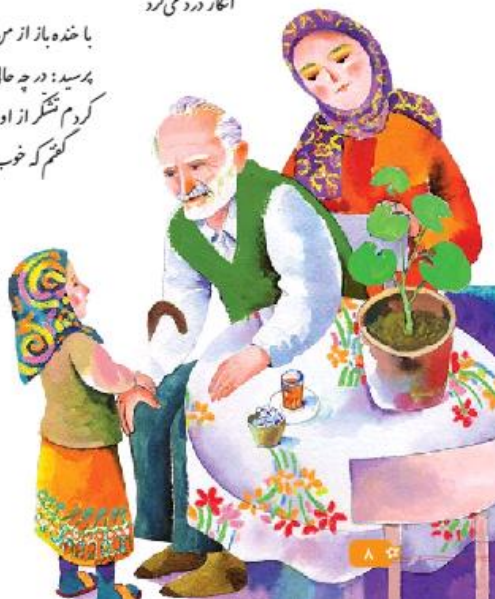
تصویر (۲). شعر «پدر بزرگ»، سال سوّم ابتدایی

شعر «پدر بزرگ»، از کتاب سال سوّم ابتدایی استخراج شده است. در این شعر نیز به نظر می‌رسد که بین استعاره‌های کلامی و غیر کلامی مطابقت نسبی وجود دارد؛ لذا، پس از طرح حوزه‌های مبدأ به‌کاررفته در متن شعر، به همخوانی آنها با تصویر پرداخته می‌شود: